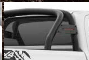
SANTANTÔNIO COM LOGO CHALLENGE