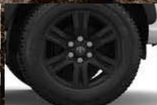
RODAS DE LIGA LEVE ARO 17" NA COR PRETA