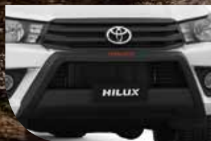
PROTECTOR DE PARA-CHOQUE