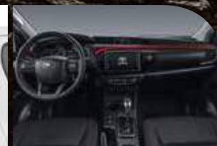
INTERIOR COM DETALHES NA COR VERMELHA