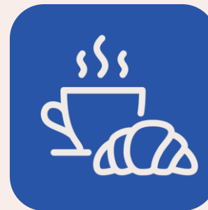
Café da manhã