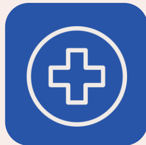
Plano de Saúde