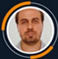
Matheus Rassi Customs Stations / Agrobusiness